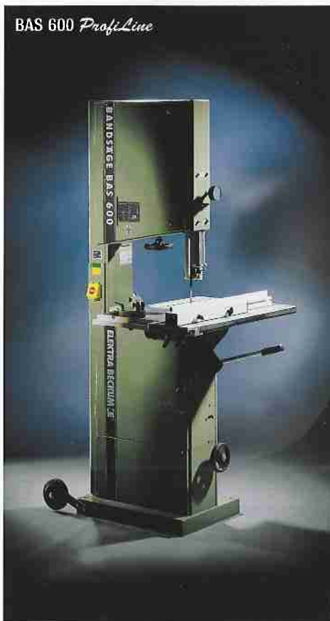
Bandsäge BAS 600 ProfiLine