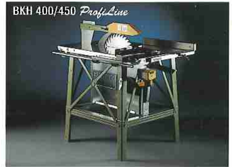
Baukreissäge BKH 400/450 ProfiLine