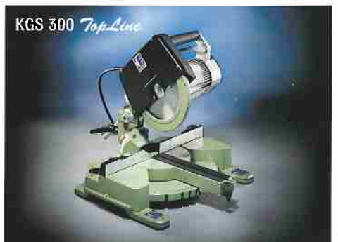
Kapp- und Gehrungssäge KGS 300 TopLine