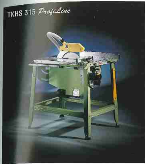
Tischreissäge TKHS 315 ProfiLine