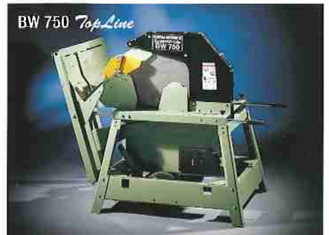
Brennholzzippsäge BW 750 TopLine