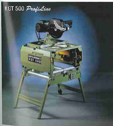
Kapp-, Gehrungs- / Tischkreissäge KGT 500