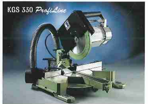
Kapp- und Gehrungssäge KGS 330 ProfiLine