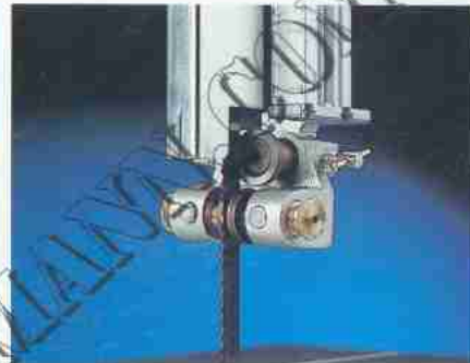
Präzisionsdreirollenführung BAS 500. Bestell-Nr. 090 901 0896