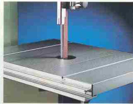
Bandschleifeinrichtung. Zum Nachbearbeiten von Schnittflächen. 2 Schleifbänder im Lieferumfang enthalten. Für BAS 350: Bestell-Nr. 090 900 5744 Für BAS 500: Bestell-Nr. 090 900 5752