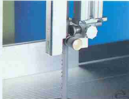
Präzisionsdreirollenführung BAS 350. Bestell-Nr. 090 901 0900 Führungsrolle aus Hartmetall, bessere Ausnutzung und Einsatzmöglichkeiten der Bandsägen, sehr hohe Lebensdauer. Einstellung und Verstellung erfolgt ohne Werkzeug, durch Schrägstellung erfolgt eine selbstständige Reinigung der Rollen, Grundkörper gehärtet und geschliffen, optimale Führung des Sägebandes.