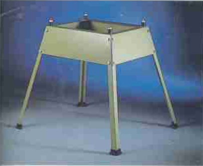
Untergestell BAS 350. Bestell-Nr. 090 900 4276