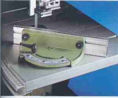
Winkelanschlag. Für BAS 350 und BAS 500. Rechts und links vom Sägeband einsetzbar. Für präzise Winkelschnitte. Bestell-Nr. 091 000 8048