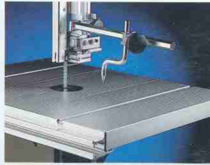
Kreisschneideeinrichtung. Zum Schneiden von Kreisen mit einem Durchmesser von 120 bis 260 mm. Bestell-Nr. 090 900 5760