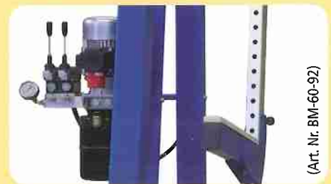
(Art. Nr. BM-60-92)