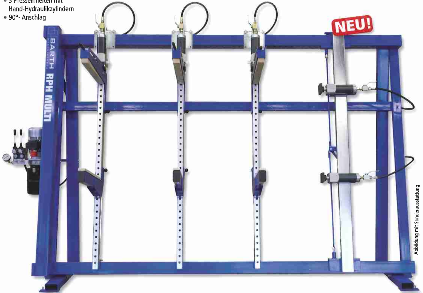
Abbildung mit Sonderausstattung