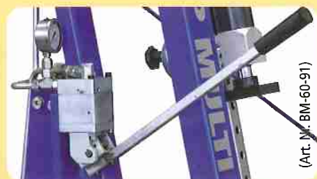
(Art. Nr. BM-60-91)