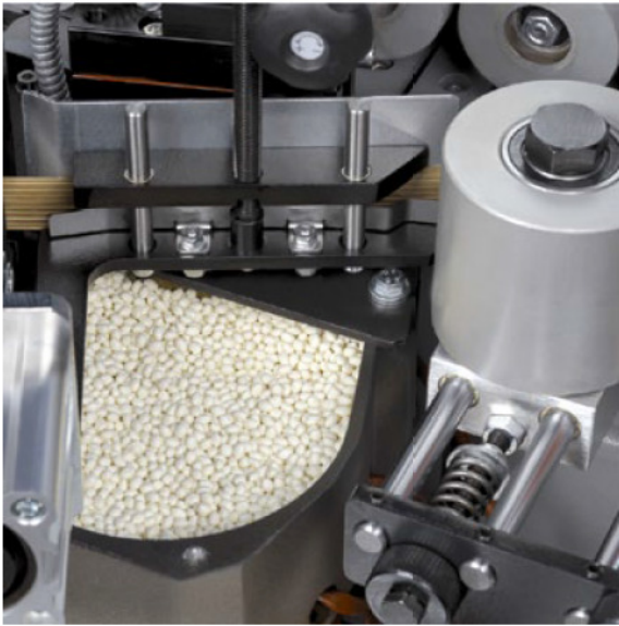
Leimbecken und großdimensionierte Anpresszone mit Schnelleinstellung