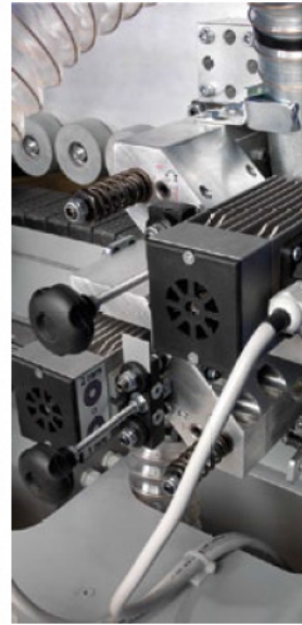
Multifunktionsfräsggregat mit Schnelleinstellung