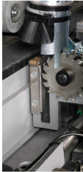
Kappaggregat mit Hochfrequenzmotor und Präzisions-Linearführungen