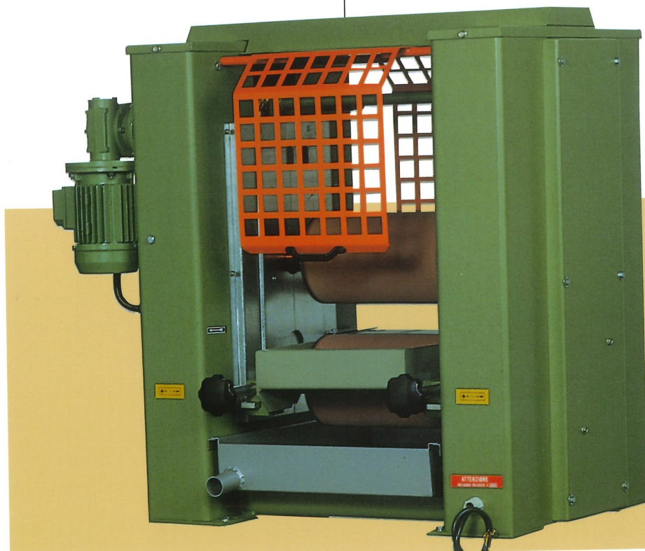
Vista posteriore Rear view

ROULEAUX ENDUISEURS , revêtus avec un spécial caoutchouc anti-acide, rectifiés et rayés, résistants à l'usure, étant construits avec une rationnelle épaisseur de caoutchouc, il est donc possible exécuter jusqu'à 6 - 7 rectifications, ils sont de facile et rapide démontage.