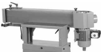
Senkrechte Schleiffläche zur Bearbeitung von Kanten

Preise einschließlich Verpackung; 24 Monate Garantie