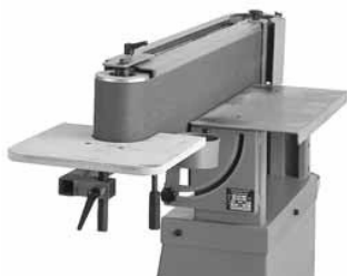
Schleiffläche senkrecht, mit Schleiftisch, zur Bearbeitung von Rundungen. Schleiftisch ist im Lieferumfang enthalten.