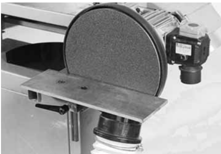
Tellerschleifeinrichtung ohne Schutzhaube, Schleiftisch mit Absaugschlauch.