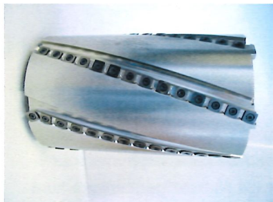
Gesamtelement der Messerwelle