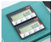
Digitalanzeige Fräsposition Digitalanzeige Frästiefe (W3013000)