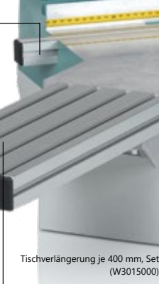
Tischverlängerung je 400 mm, Set (W3015000)