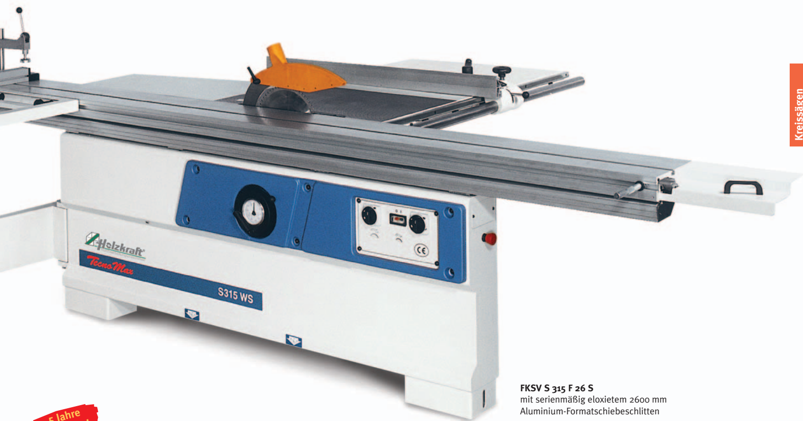
FKSV S 315 F 26 S mit serienmäßig eloxiertem 2600 mm Aluminium-Formatschiebeschlitten