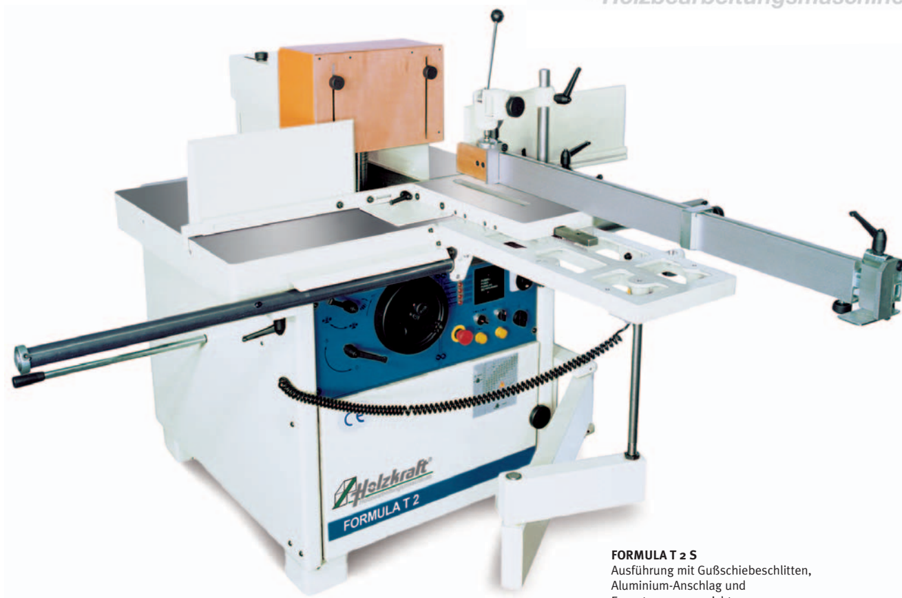
FORMULA T 2 S Ausführung mit Gußschiebeschlitten, Aluminium-Anschlag und Exzentersternvorrichtung