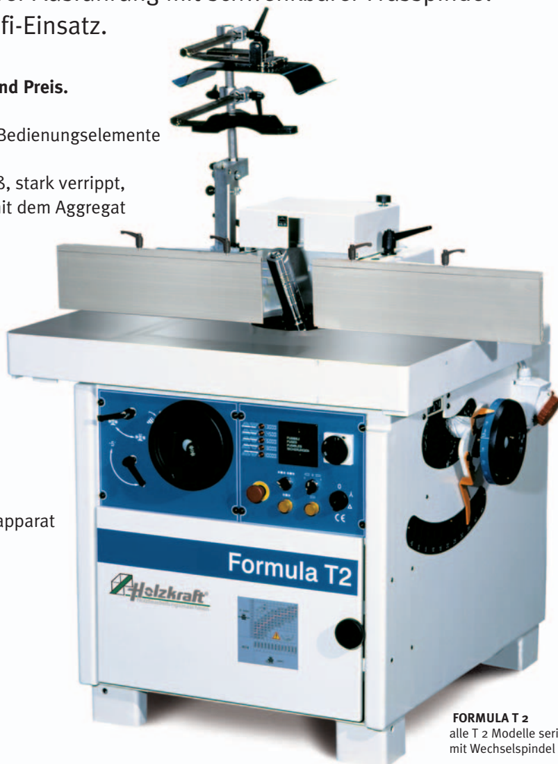
FORMULA T 2 alle T 2 Modelle serienmäßig mit Wechselspindel MK 4