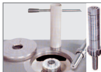
■ Wechselspindel MK 4 serienmäßig bei allen FORMULA - T 2 Modellen