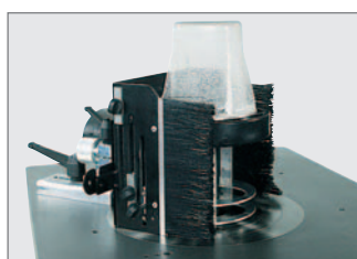
■ Bogenfrässchutzhaube für die Bearbeitung an der Spindel serienmäßig