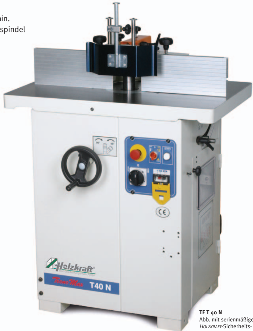
TF T 40 N Abb. mit serienmäßigen HOLZKRAFT-Sicherheits-Wendeanschlagbacken aus Aluminium