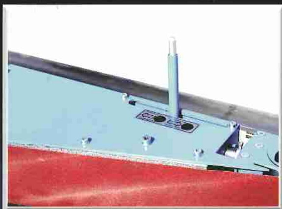
MECHANICKÉ NAPÍNÁNÍ PÁSU MECHANICAL BELT STRETCHING МЕХ. НАПРЯЖЕНИЕ ЛЕНТЫ