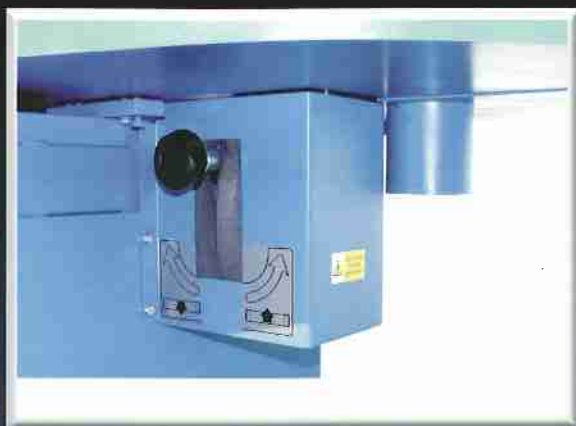
NASTAVENÍ OSCILACE ADJUSTMENT OF OSCILATION УСТАНОВЛЕНИЕ КОЛЕБАНИЯ