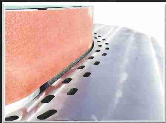
ODSÁVÁNÍ EXHAUSTING ОТСАСЫВАНИЕ