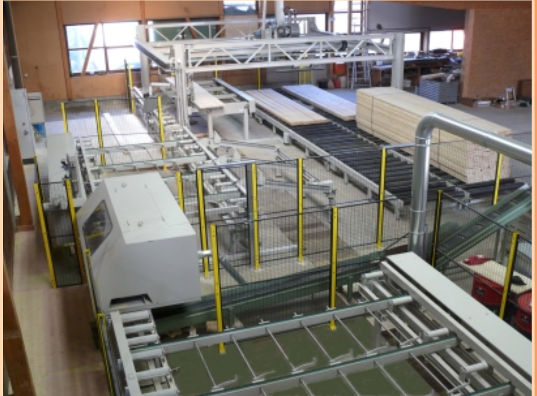
Kappanlage mit Vakuum-Entstapelung (Brettschichtholz-Produktion) ↑