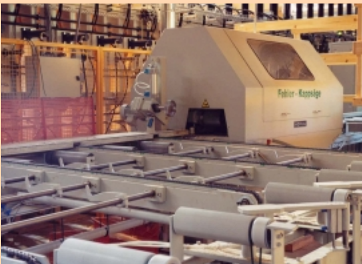
Einsatz in einer KVH-Produktion ↑