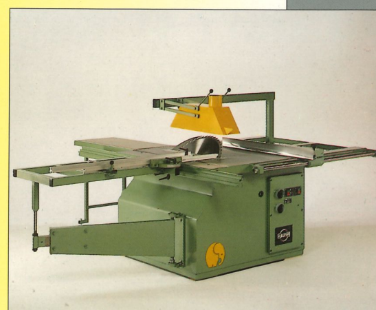
Schwere Tischkreissäge Typ Jumbo

Typ 130 mit Schrägverstellung 0-45 Grad und Motor 7,5 PS / 380 Volt, 3 ~.