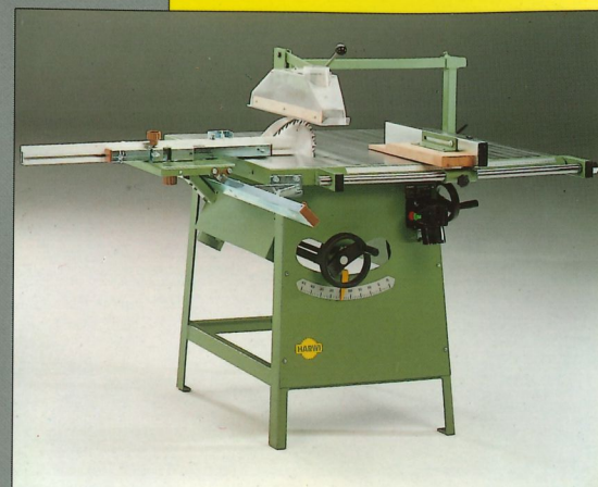
Kreissägemaschine Typ 100-S

Alle Typen sind in Standardausführung von 0-45° Grad schrägstellbar. Motor 2 PS / 220 Volt, 1 ~.