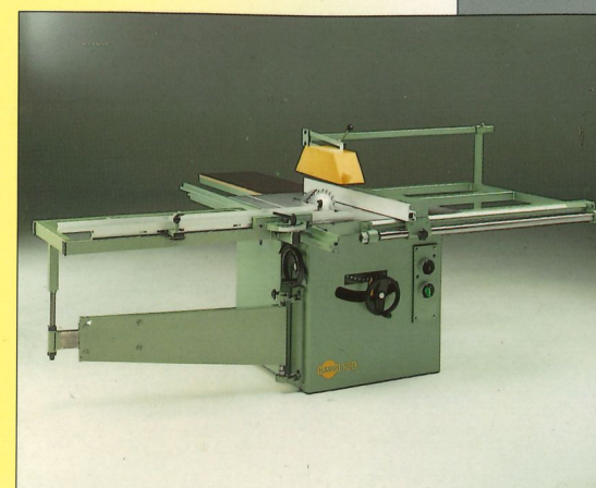
Tischkreissäge Typ 130