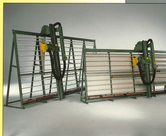
Vertikale Plattensäge Typ Giraffe

Typ Jumbo mit Schrägstellung 0-45 Grad. Motor 15 PS / 380 Volt, 3 ~.