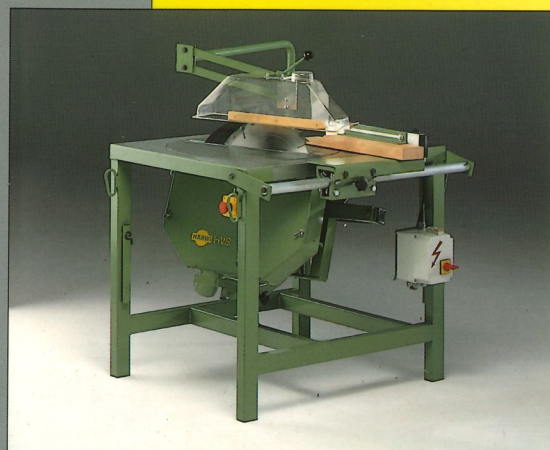
Baukreissäge Typ HVS