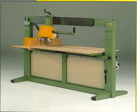
Radialkreissäge Typ 625-2K

Genau wie Typ 625-H und 625-U ist die 625-2K mit einem Motor 4 PS / 380 Volt, 3 ~ ausgerüstet.