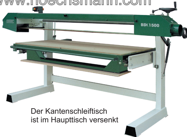
Der Kantenschleiftisch ist im Haupttisch versenkt