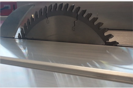
Sägeaggragat, max. Sägeblattdurchmesser 400 mm