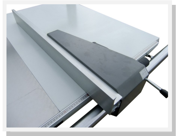
Parallelanschlag 900 mm mit Feineinstellung