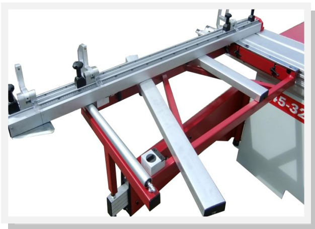
Großflächiger Tischausleger 1280 x 630 mm (verschiebbar) mit Materialrolle, Winkel- und Gehrungsanschlag (ausziehbar bis 3400 mm)