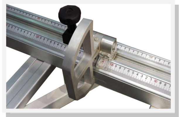
Stabile Klappanschläge mit Lupe