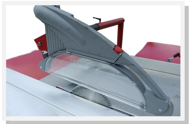
Parallelogramm Absaugvorrichtung mit schaler und Breiter Absaughaube, wegschwenkbar