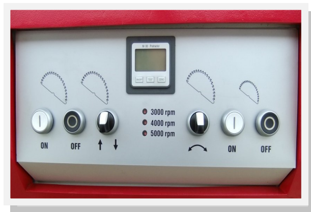
Digitale Anzeige des Sägewinkels