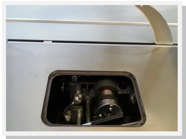
Tischöffnung 250 x 150 mm für schnellen und einfachen Drehzahlwechsel