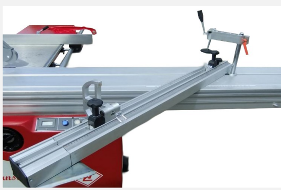
Gehrungsanschlag 900 mm, mit Extenterspanner