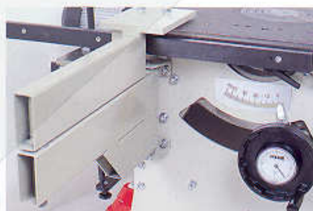
Wegschwenkeinrichtung für Vorschubapparat