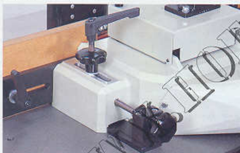
Präzisionsfräsanschlag mit kombinierter Feinverstellung (anstelle Standardanschlag)