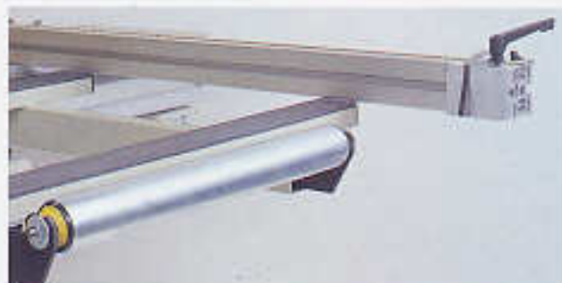
Rahmentischrolle, für Rahmentisch G 3Z 560