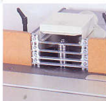
Sicherheitseinsätze für Fräsanschlag