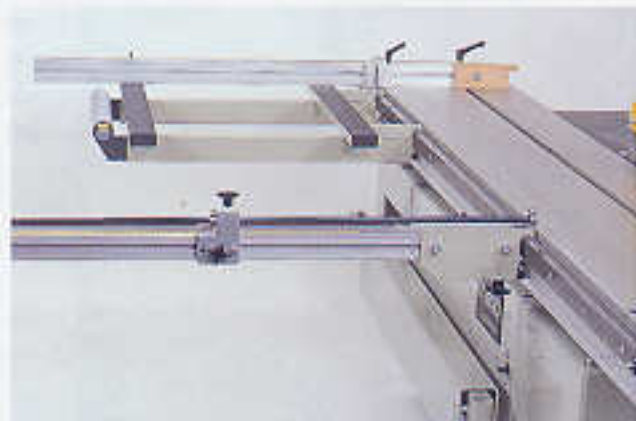
Rahmentisch in Längsrichtung an beliebiger Stelle am Formatschiebetisch einzuhängen, 660 x 600 mm G 3Z 240