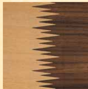
Fingerzinken-Stanzwerkzeuge mit versetzten Zinken, spitzendichte und optisch perfekte Deckfurnier-Zusammensetzungen.