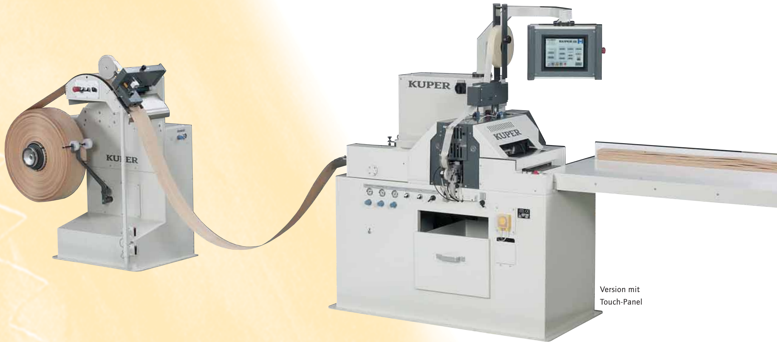
Version mit Touch-Panel

Bei steigenden Furnierpreisen wird die Verwertung von Furnierkürzungen und Restabschnitten für untergeordnete Zwecke (z.B. Schrankrückwände und Einlegeböden) immer interessanter. Das gilt auch für dickere Mittellagenfurniere für Sperrholzplatten und sogar für die Mittelanlagen von Sperrholzformteilen. In einigen Ländern werden besonders dünne Furniere (Mikrofurniere) vorrangig für Ummantelungen eingesetzt. Auch diese sehr dünnen Furniere können gezinkt und zusammengesetzt, also „verlängert“ oder in Rollenform gebracht werden. Auf diese sehr unterschiedlichen Anforderungen hat sich KUPER mit verschiedenen ZI/ZU-Ausführungen eingestellt.