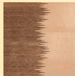
Fingerzinken-Stanzwerkzeuge mit VARIO-Zahnform, ermöglicht eine noch weniger sichtbare Verbindung durch die geschwungene Linienführung.