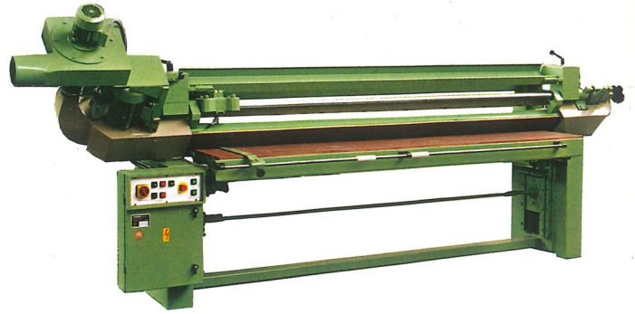
LZG-S in 45° Zwischenstellung