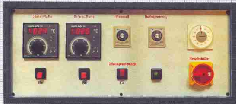
Elektronische Temperaturregelung mit digitaler Anzeige Electronic temperature control with digital indication