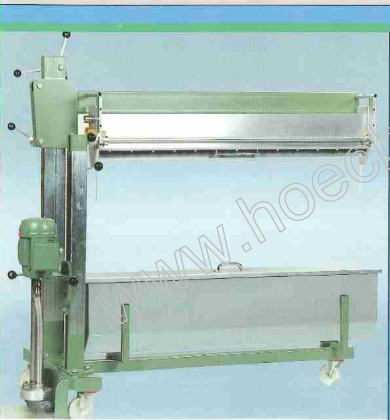
Selvstændig mobil laksektion. Independent mobile coating section. Selbständige fahrbare Giessabteilung. Section de vernissage mobile et indépendante.

Motor for affejningsbørste 0,37 kw Motor für Abbürsteinrichtung Motor for sweeping brush Moteur de balai