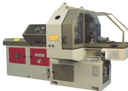
Utensili in lavorazione Tools on working