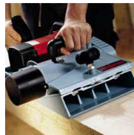
Neuartiger Spanauswurf mit Absaugmöglichkeit für 75/80 mm Saugschlauch.