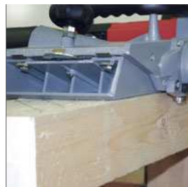
Mit Anlaufrolle - für maximale Nutzung der Hobelbreite.