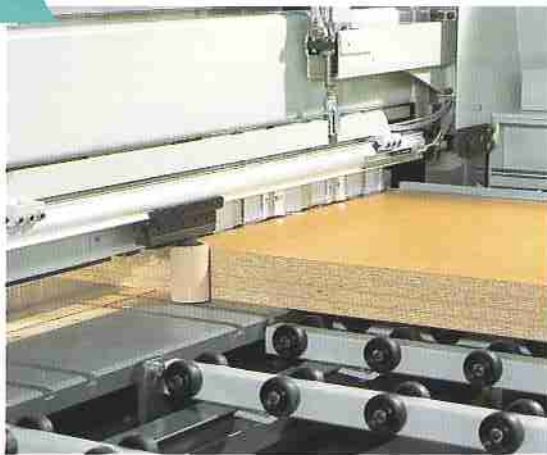
Oben: Paketklemmer im Einsatz Unten: Anpreßvorrichtung

▲ Die Maschine ist staubgeprüft und besitzt das GS-Zeichen (Nr. 951061) sowie das CE-Zeichen (Nr. 951062).