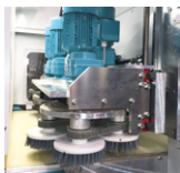
Das Profi Disk Aggregate als optionales Zusatzaggregat am Ein- und/oder Auslauf der Maschine