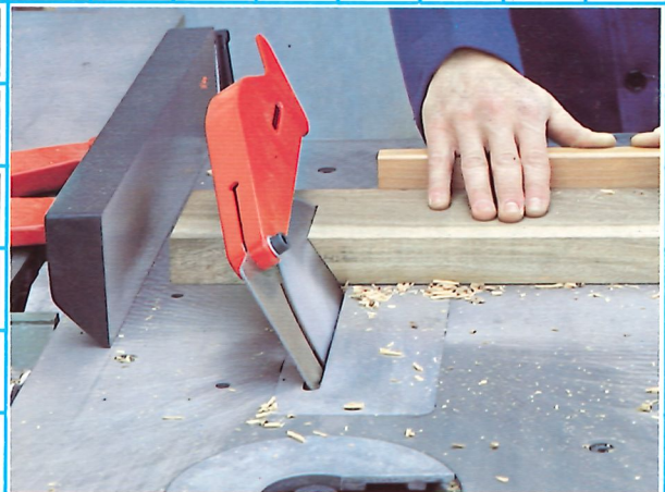
CHARIOT A EQUARRIRE: Avec lame inclinable 0-45°. Le chariot glisse sur un bar d'acier rectifié et roulements à billes.