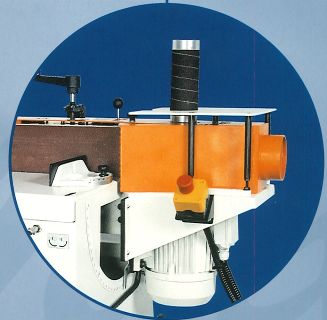
LU 150 Maschine in CE Ausführung