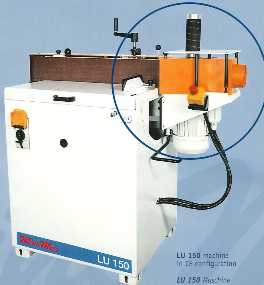
LU 150 machine in CE configuration

LU 150 ist ein universelles Schleifzentrum mit Schwingband. Das Schleifaggregat kann sich bis zu 90° drehen und ermöglicht einen präzisen Schliff von geraden und schrägen Innen- und Außenprofilen.