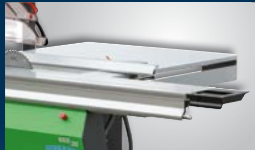
680|20 guide parallèle à déplacement motorisé

Les modèles 680/10 et 680/20 incarnent une nouvelle génération de scies à format qui apportent une harmonie, des caractéristiques, de la couleur et du concept.