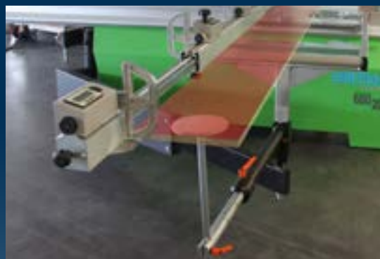
Plateau support additionnel confort pour faciliter l'appui des pièces longues contre le guide transversal