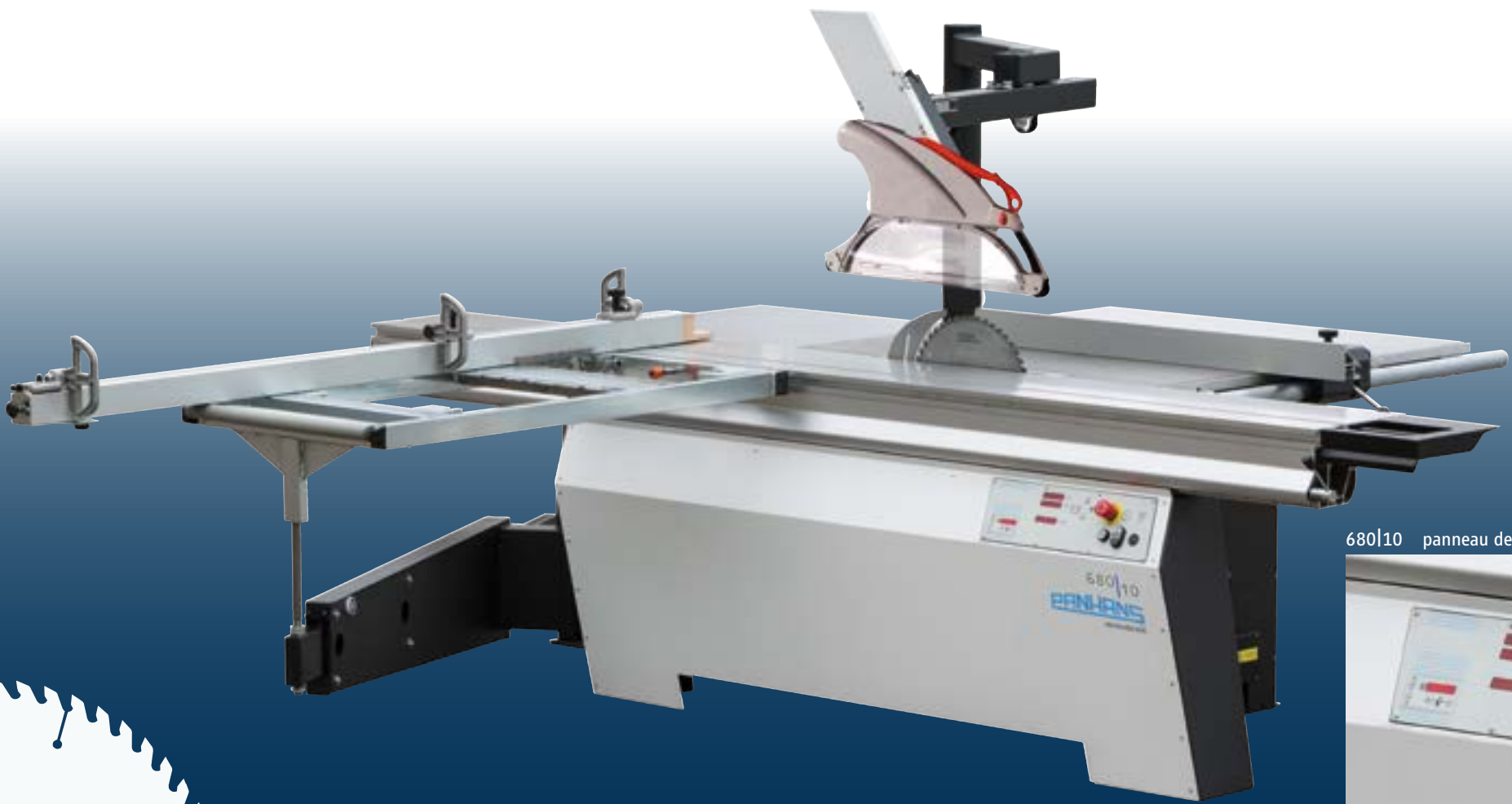
680|10 panneau de commande au bâti machine