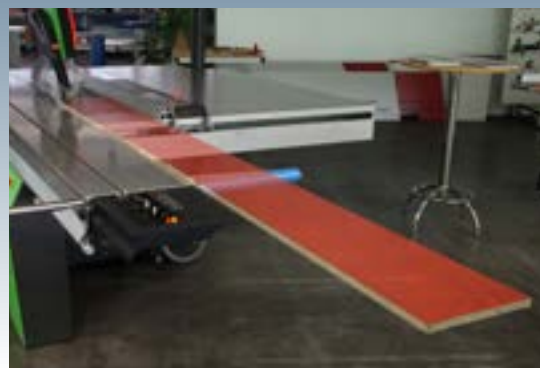
Innovant Support d'appui complémentaire