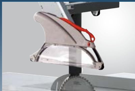
Capot de protection pivotable pour toutes les positions de la lame de scie