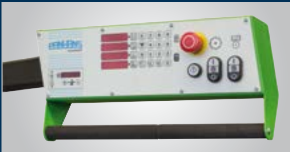
680|20 panneau de commande à hauteur des yeux