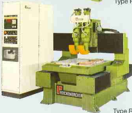
Type RANC - 310 A2