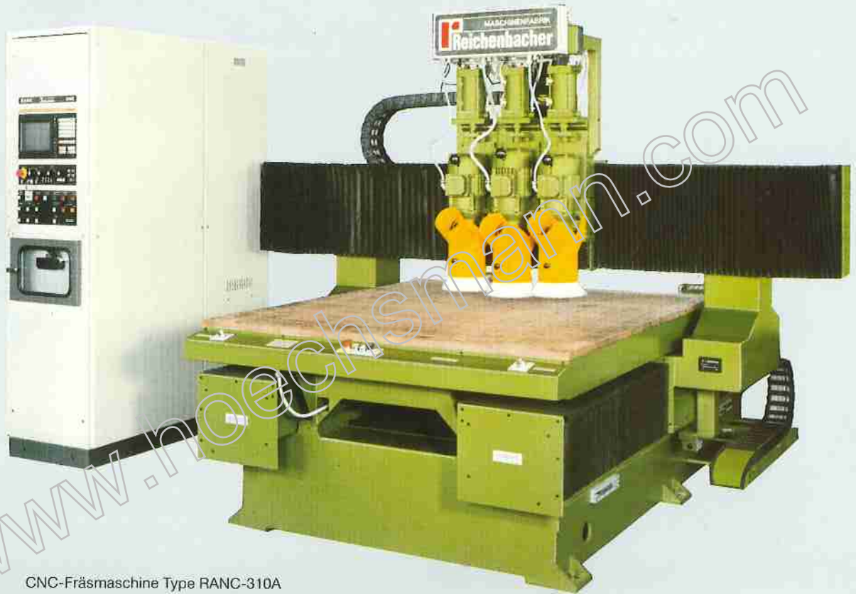
CNC-Fräsmaschine Type RANC-310A

Sägen, Schleifen ). Werden mehrere Werkzeuge an einem Teil benötigt, hat sich der Einsatz des 4- oder 6-fach-Schwenkkopfes oder auch unser neuentwickelter automatischer Werkzeugwechsler bestens bewährt. Der Maschinentisch ist mit einer Rasterplatte ausgestattet, sodaß die Werkstücke direkt auf dem Tisch oder die Spannvorrichtung mit Vakuum gespannt werden können.