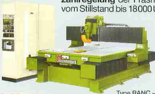
Type RANC - 310 A1

Eine 4. numerisch gesteuerte Achse ermöglicht, den Fräsmotor oder das Werkstück zu schwenken, oder auch 360 Grad zu drehen . Bitte nennen Sie uns Ihre Bearbeitungsaufgaben.