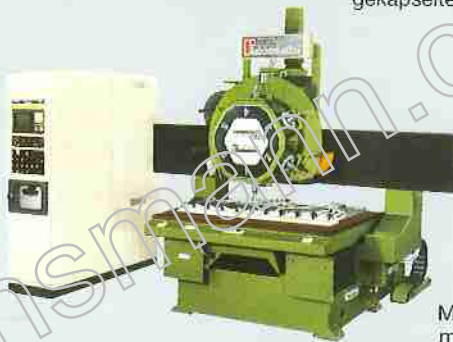
Maschine mit 6-fach-Schwenkkopf