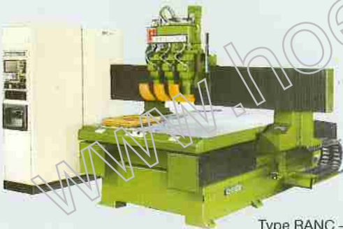
Type RANC - 310 A3