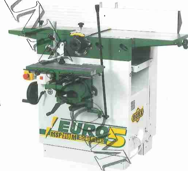
MSP 310M + VDA 315