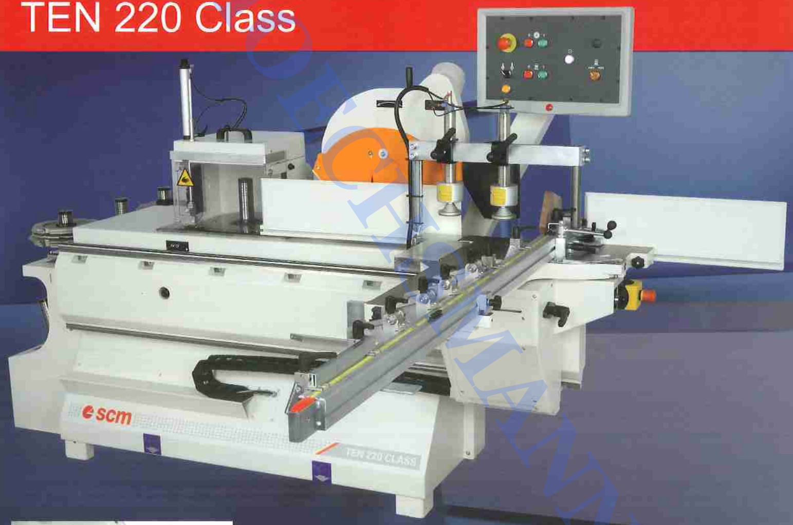
Ten 220 Class in CE configuration Ten 220 Class in CE Ausführung