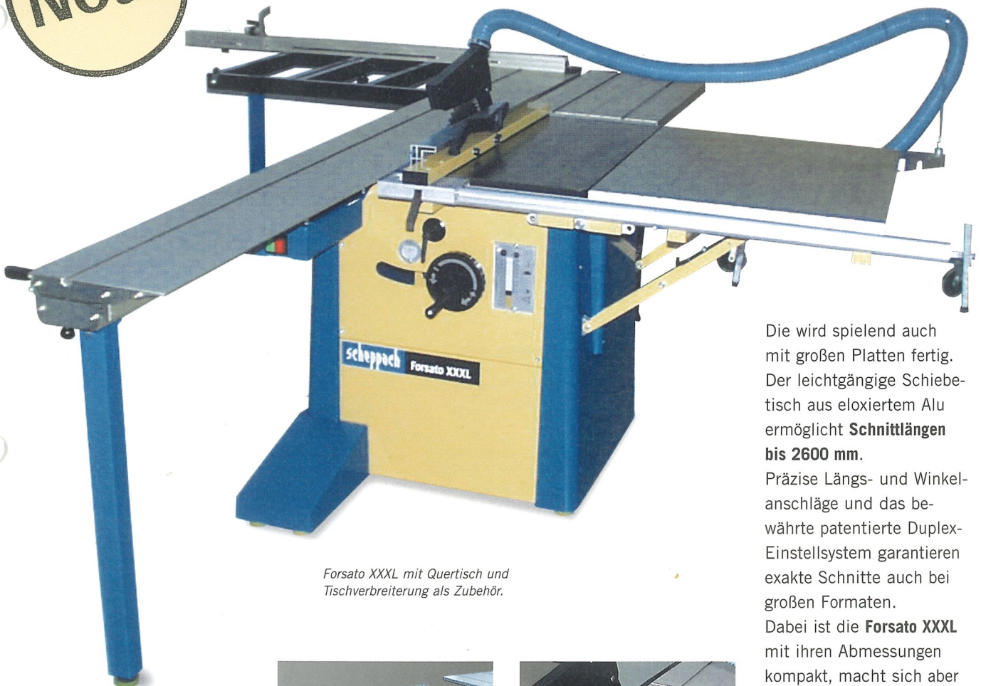
Forsato XXXL mit Quertisch und Tischverbreiterung als Zubehör.