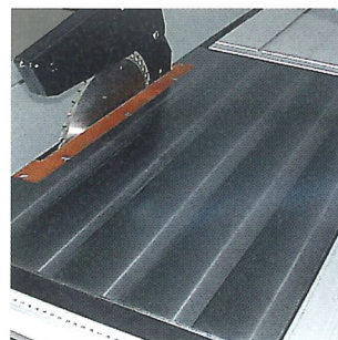
Die plangenaue und verwindungs- steife Tischplatte aus Grauguss erfüllt alle Anforderungen der Profis.