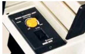
mit variabler Geschwindigkeit