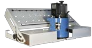
Winkeltisch mit Aufnahme für den Kantenknirps