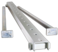
Tischverbreiterung für die MLP1750