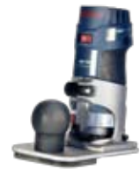
Kantenfräse incl. Bündigfräsvorsatz