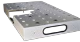
Kugeltisch mit Aufnahme für den Kantenknirps