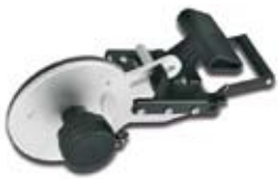
Kappvorrichtung Rundkanten / Stosskanten