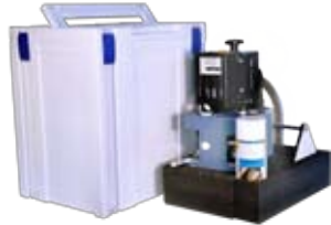
Systainer für den Kantenknirps