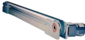
Vorschub-Einheit für die MLP1750