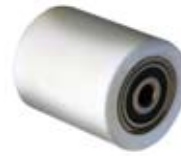
Zusatzrolle 55 mm