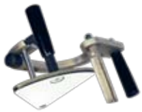
Handgriff für den Kantenknirps