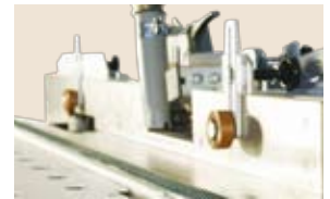
zum perfekten Ergebnis