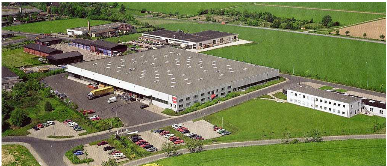
Luftaufnahme Firmengebäude SPÄNEX

Von der Planung bis zur fertigen Anlage ist es ein langer Weg. In allen Phasen steht Ihnen SPÄNEX mit Kompetenz und Erfahrung aus der Realisierung mehrerer Tausend Anlagen zur Seite.