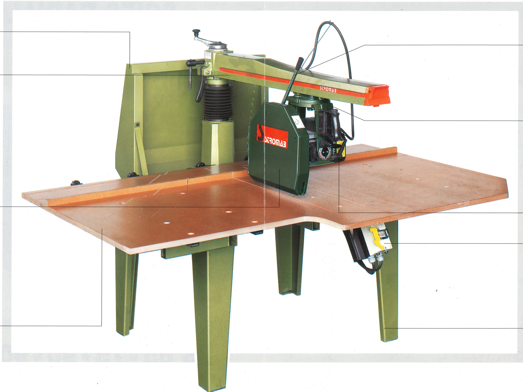
Table en bois de grandes dimensions.

Levier à bielles pour réglage rapide de la protection de lame.