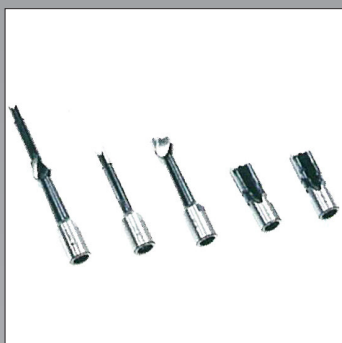
Punte di dotazione Bits supplied with the machine Meches fournies avec la machine Brocas en dotacion