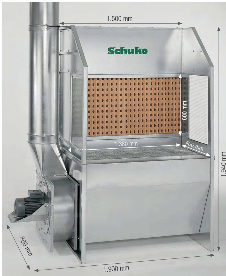
Das ideale Gerät für die Lacknebel- und Dunstabsaugung.

■ Der Schuko SAUGBOY lässt Ihre Mitarbeiter nicht länger im Nebel stehen. Das kompakte Gerät, speziell für Kleinteillackierungen entwickelt, bringt Schuko-Leistung zum günstigen Preis.