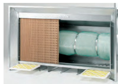
Leichte Zugänglichkeit sichert schnellen, problemlosen Wechsel der kostengünstigen Filter.