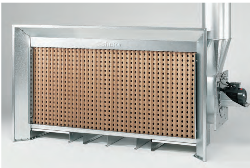
Solide Kompaktbauweise mit geringer Bautiefe – genau richtig für kleine Räume und Werkstätten.

Einfacher elektrischer Anschluss, kein zusätzlicher Schaltschrank erforderlich. Im Lieferumfang enthalten ist das Anschlusskabel mit 7 m Länge mit Motorschutzstecker und Schalter nach CEE für den Anschluss außerhalb des Ex-Bereiches.