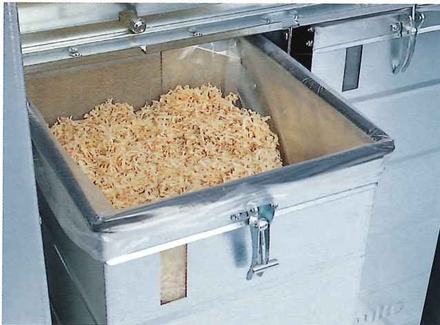
■ Spänesammeltonne mit Füllstandsfenster und Schnellverschluss

■ Unterbau mit Austragungs-schnecke und Rührwerk, für den Anschluß einer Schnecken-austragung für Containerbefüllung