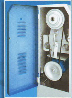
4-скоростна ремьчна предавка Riemenantrieb mit 4 Geschwindigkeiten 4-speeds belt gear