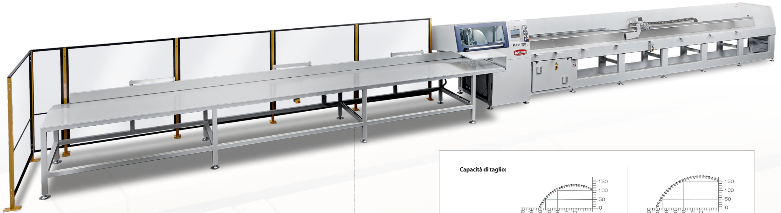
Capacità di taglio: