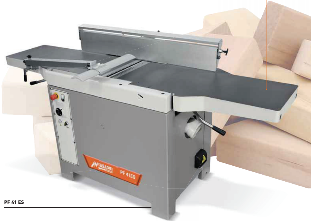
PF 41 ES

The PF 41 ES surface planer is an entry-level machine with the performance of a professional machine! Die PF 41 ES Abrichtobelmaschine ist ein Entry-Level Modell mit den Leistungen einer professionellen Maschine.