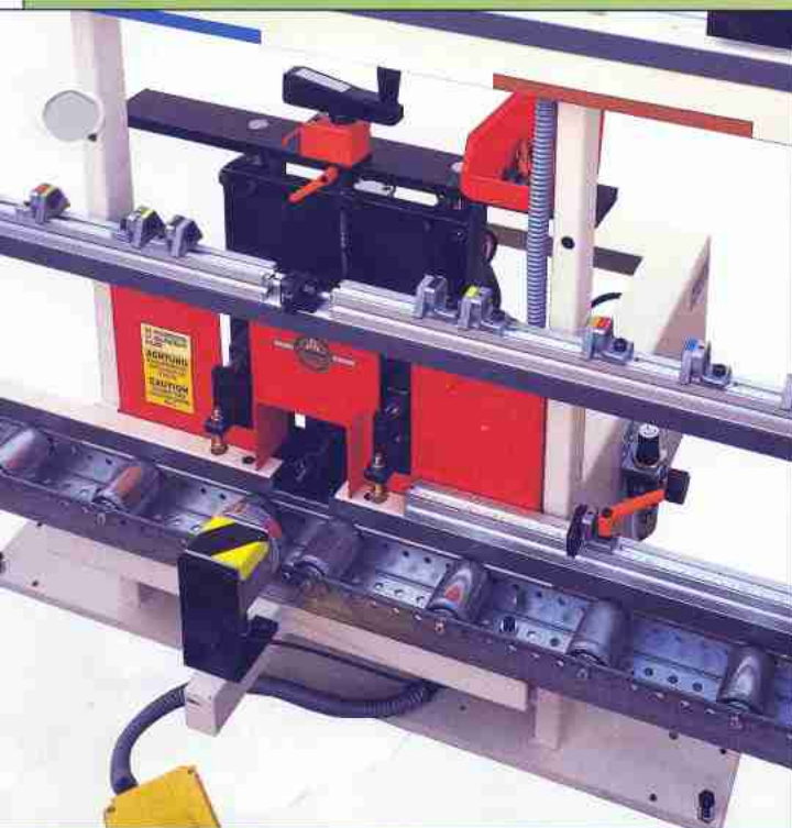
Abbildung zeigt Profi standardmäßig mit integrierter Späneabsaugung, ohne Höhenabstufung ▷