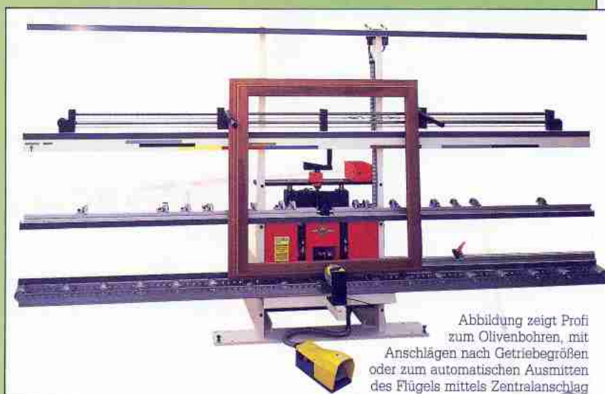
Abbildung zeigt Profi zum Olivenbohren, mit Anschlägen nach Getriebegrößen oder zum automatischen Ausmitten des Flügels mittels Zentralanschlag