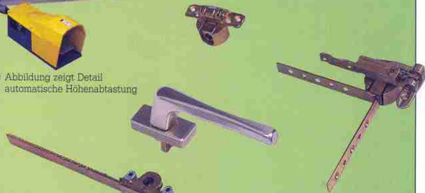
◁ Abbildung zeigt Detail automatische Höhenabstufung