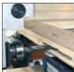
Machinings of inside doors Bearbeitungen der Innentüren Обработка межкомнатных дверей