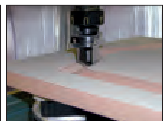
Machinings of furniture components Bearbeitungen der Möbelbestandteile Обработка мебельных деталей