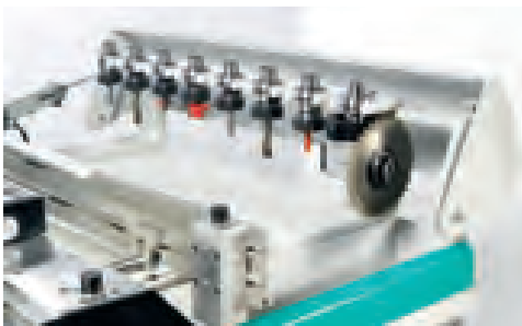
CNC 353 CNC 353/N

8 positions tool changer Zuführungsmagazin mit 8 Positionen магазин 8 положений