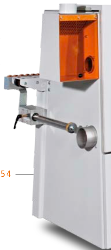
STREAMER 1053 | 1054

Ihr kompakter Einstieg in die HOLZ-HER Kantentechnik