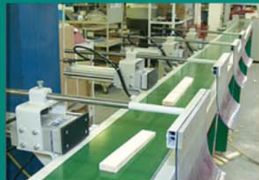
Sortierband mit Auswerfstationen