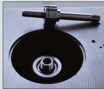
Albero intercambiabile MK 4 Interchangeable spindle MK 4 Wechselspindel MK 4 Arbre interchangeable MK 4 Eje intercambiabile MK 4