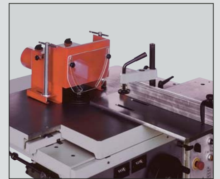
Cuffia e pianetto a tenonare Tenoning hood and tenoning table Zapfenschneidhaube- und Schlitzapparat Capot et table à tenonner Protector y plano para espigar