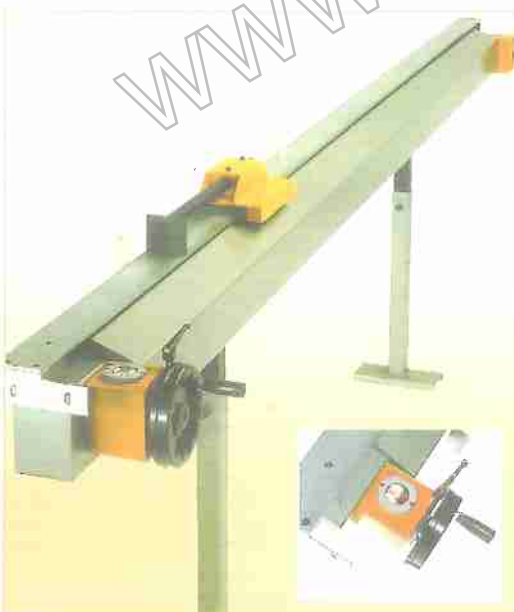
Bancale TOP 3 - TOP 3 base - Banc TOP 3