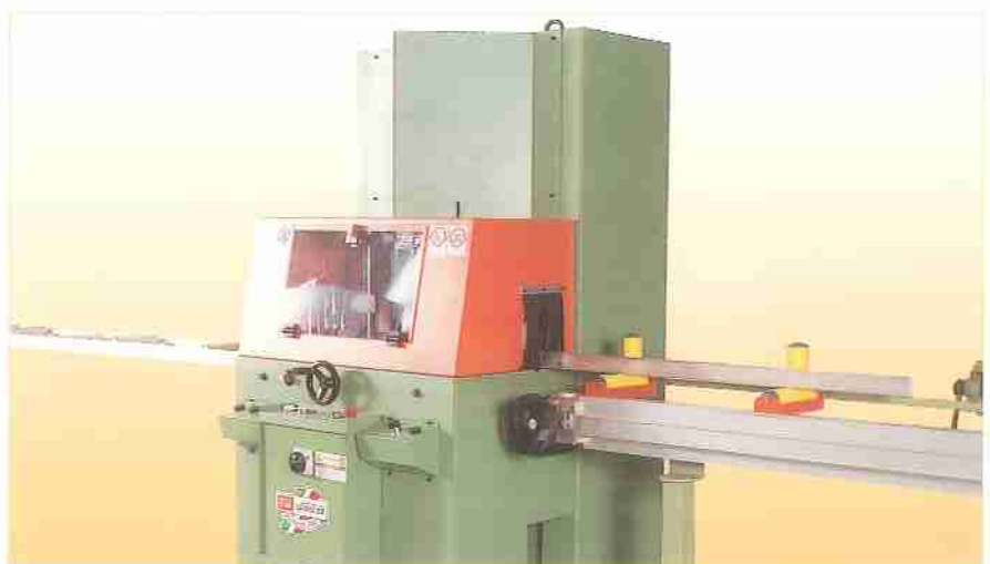
TV-500, TOP 3.