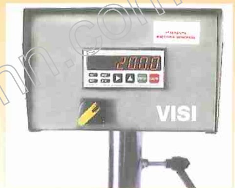
Particolare di lettura e visualizzazione. Detail of reading from display. Détail de lecture et visualisateur.