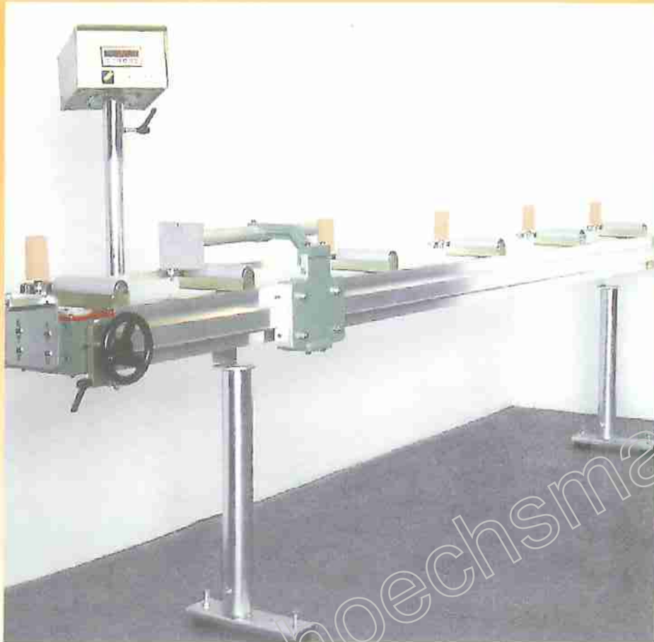
Rulliera VISI - VISI roller stand - Convoyeur à rouleaux VISI

BANCALE LATO SCARICO A RULLIERA CON FERMO MOBILE UNLOAD SIDE ROLLER BED WITH MOVABLE STOP TABLE COTE DECHARGEMENT A ROULEMENT AVEC ARRET MOBILE