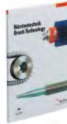
Bürstentechnik Gesamtprogramm Brush Technology