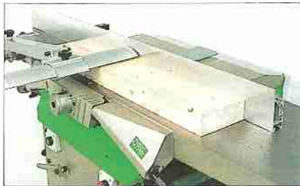
Abrichten (flach oder hochkant). langer Aufgabebereich (850 mm).