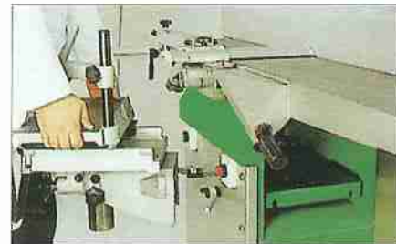
Abnehmbare Langlochbohrvorrichtung mit separater Höhenverstellung.