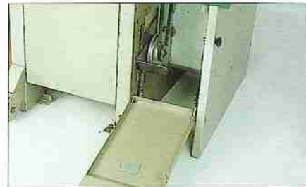
2 Vorschubgeschwindigkeiten (5 und 12 m/mn) durch Vorschubmotor (0,33 PS) (2 Sitzungen vom Riemen).