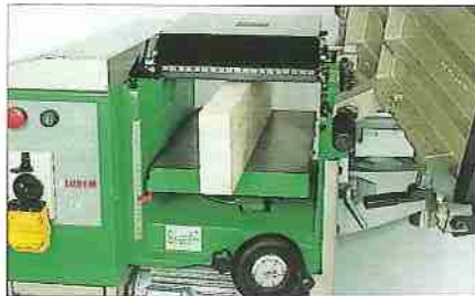
Maxi. Durchlaßhöhe: 230 mm. Automatischer Holzvorschub.