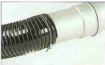
Anschlußmuffe (Durchmesser 100 mm), erleichtert das Anschließen an eine Absauganlage.