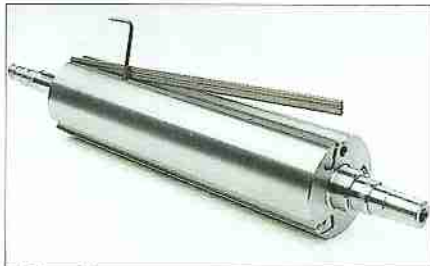
Selbstspannende 3-Wendmesser Hobelwelle.