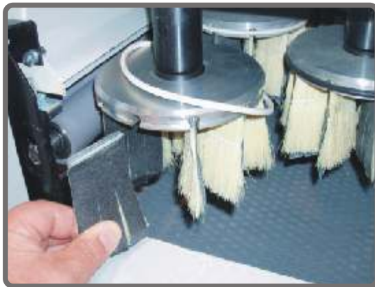
Disc brushing unit – exchange of insersts Disk Bürsten – die Futer Auswechslung Diskový kartáč- výměna insertu Dyskowa szczotka – wymiana segmentow listkowych Дисковые щетки – сменна оброзивных сегментов