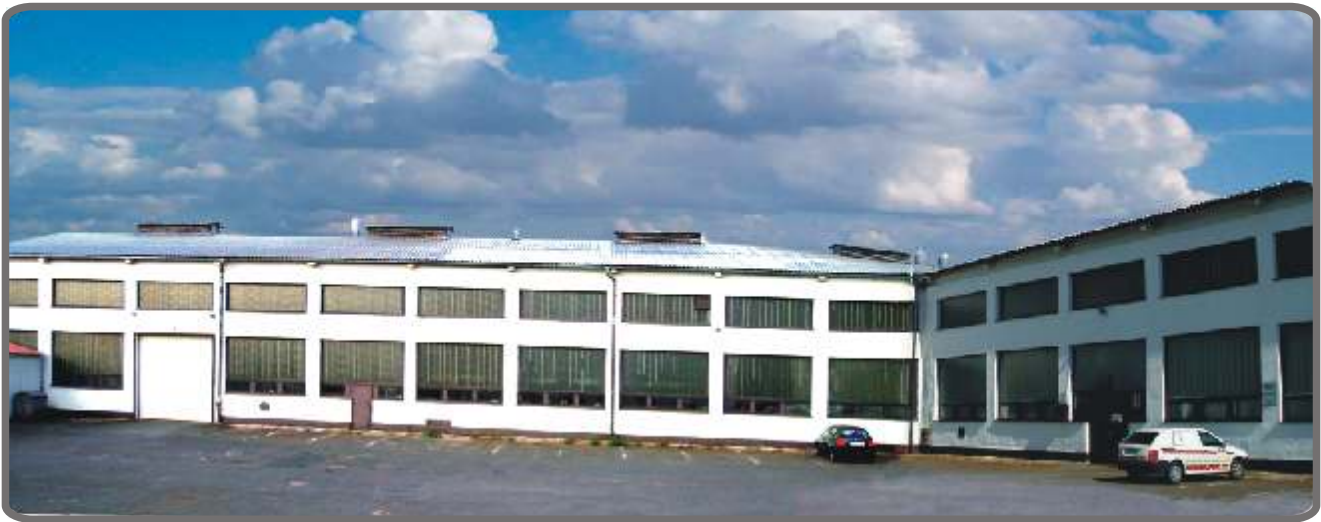
Factory - Das Werk - Výrobní závod - Fabryka - Производство