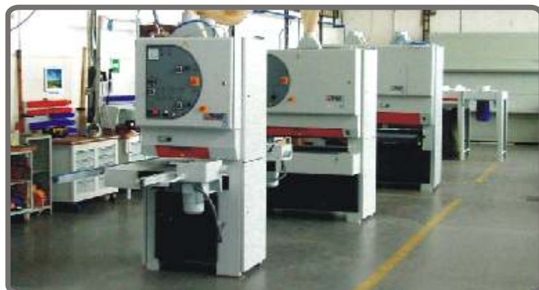
Assemblage - Die Montage - Montáž - Montaż - Сборка

RWT s.r.o., Jiráskova 899/2 516 01 Rychnov nad Kněžnou Czech republic e-mail: rwt@rwt.cz http://www.rwt.cz