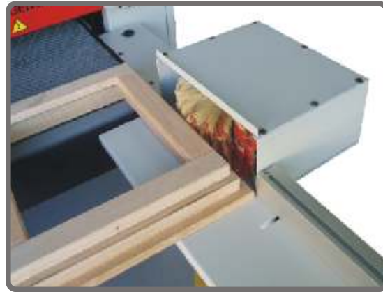
Vertical brush Die Vertikal Bürste Vertikální kartáč Pionowa szczotka Вертикальная щетка