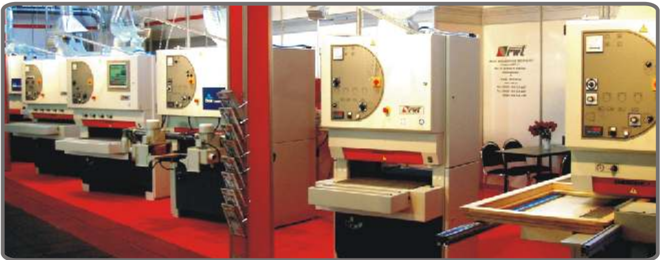
Exhibition - Die Ausstellung - Veletrh - Targi - Выставка